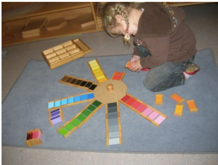
Bild des Kindes

In der Montessori Pädagogik stehen das Kind und seine Individualität im Mittelpunkt. Ein Kind kommt mit einer Vielzahl an Bedürfnissen und Kompetenzen auf die Welt: Kontaktfreude, Neugierde, Urvertrauen, Lebenswille, Wahrnehmungsfähigkeit, Differenzierungsfähigkeit.